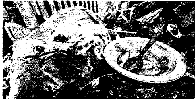
RECIPIENTES com água podem ser criadouros do Aedes aegypti

ALEXIA VIEIRA alexia.vieira@opovo.com.br